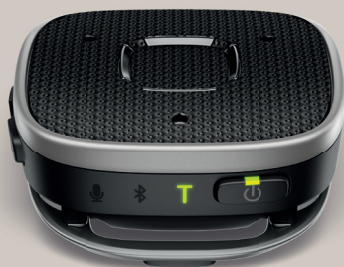
Det aktuella läget visas i de tre ljuslägesindikatorerna (6).